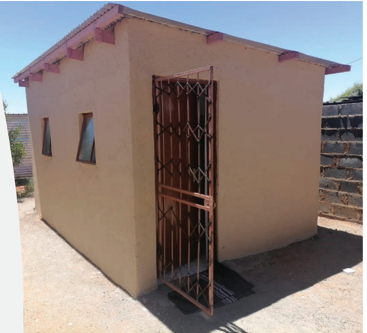
Die voltooië infrastruktuur

Ons is seker dat die kinders wat na dié sentrum gaan dit sal geniet om na die verbeterde skool terug te keer vir 'n jaar van pret en leer!